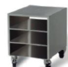
Mesa con ruedas