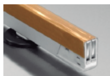
Doble sellado en bolsa