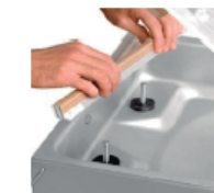
Barra de soldadura extraíble con dos resistencias.