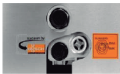
Fácil cambio de aceite